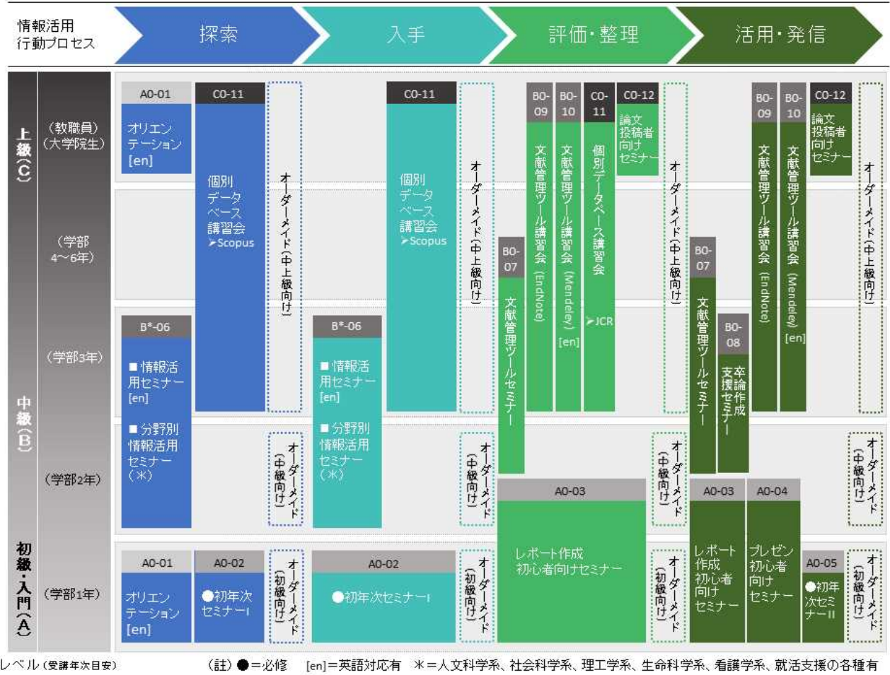
プログラム体系図

4年生は、3年生までに身に付けた情報リテラシーを活用しながら、大学での学びや探究の総括を行う学年です。図書館では、中上級レベルの各種プログラムを提供するとともに、オーダーメイド型ガイダンスで個別の相談にも応じています。どうぞ活用ください！